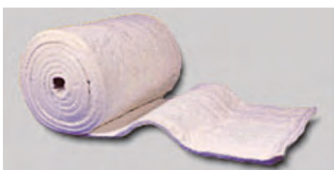
Рис. 4. Маты из керамоволокнистого полотна

К таким материалам относятся керамоволокнистые сборные футеровки в виде плит, матов (рис. 4) или модульных блоков (рис. 5) с температурой применения до 1400 °С. Легковесные футеровки достаточно просто монтируются, обладают