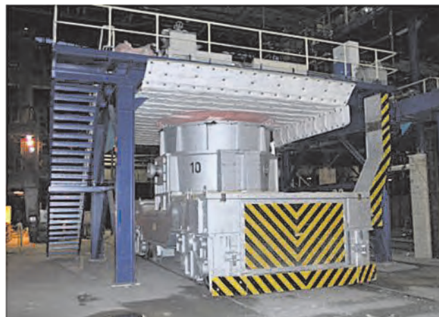
Рис. 2. Стенд нагрева ковшей

• установки нагрева штампов непосредственно в прессе (рис. 3) и нагрева кромок перед сваркой;