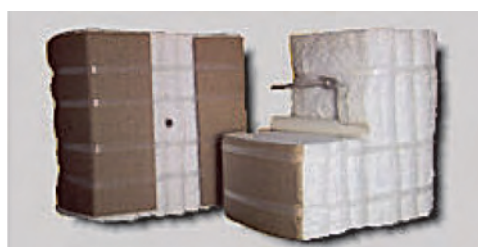
Рис. 5. Керамоволокнистые модули

Применение в термических агрегатах огнеупорных и теплоизоляционных материалов нового поколения, современных систем нагрева, рекуперации, регенерации в комплексе с системами контроля и автоматизации позволяет снизить энергоемкость оборудования более чем на 50%. Окупаемость таких агрегатов составляет 6–12 мес в зависимости от их размера.