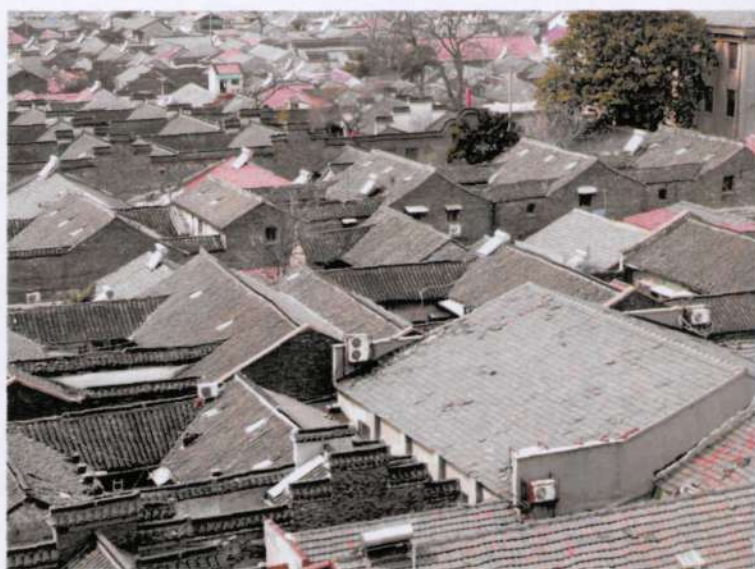
2. Планировка исторических кварталов в городе Янчжоу с узкими улицами и плотной, преимущественно одноэтажной застройкой