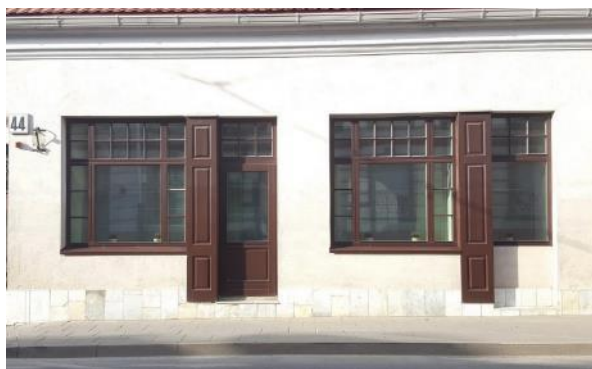
Мал. 2. Вільнюс. Сучаснае выкарыстанне традыцыйнага формаўтварэння.