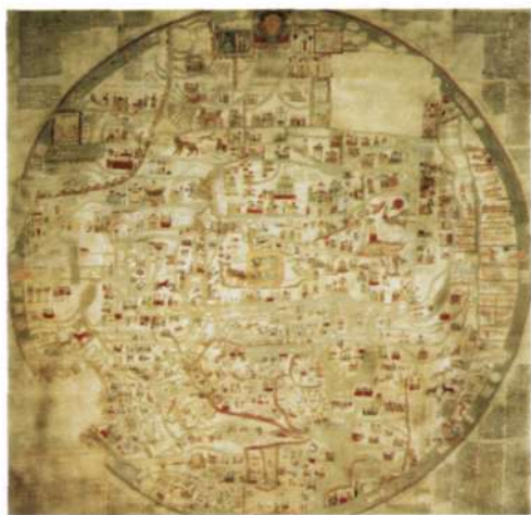
1. Карта мира. В центре Иерусалим с изображением Христа. Середина XIII века