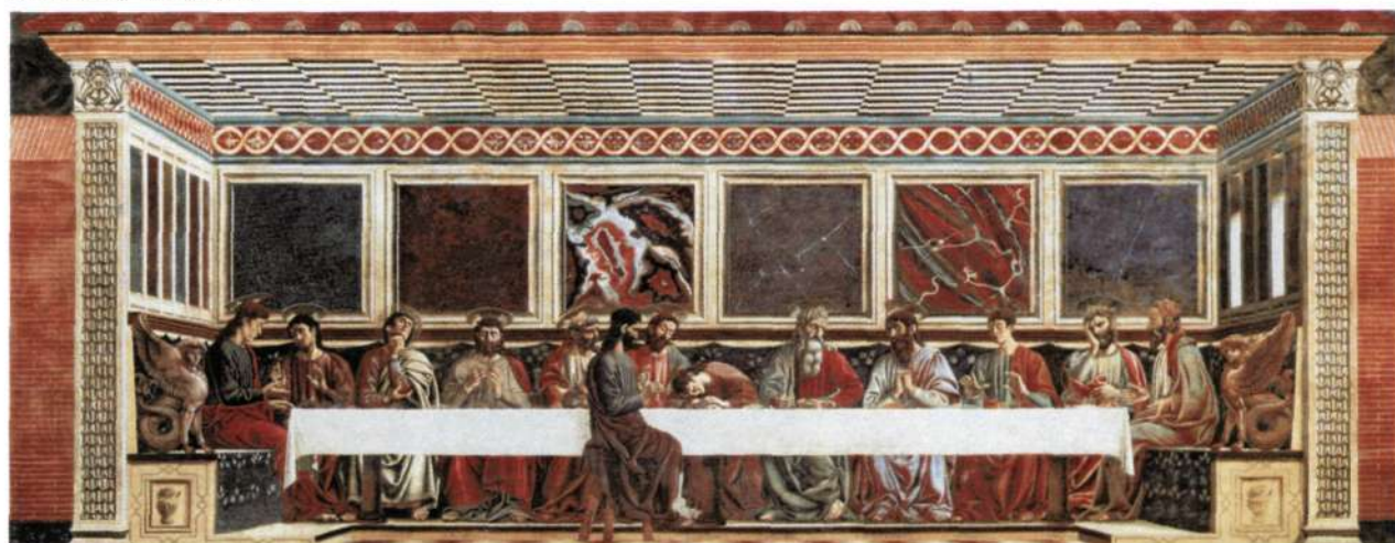
5. Андреа дель Кастанья. «Последняя тайная вечеря». После 1450 г. Храм Святого Апполинария. Флоренция