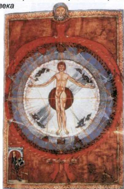
3. Космический человек. Миниатюра. «Книга божественных деяний», 1230 год