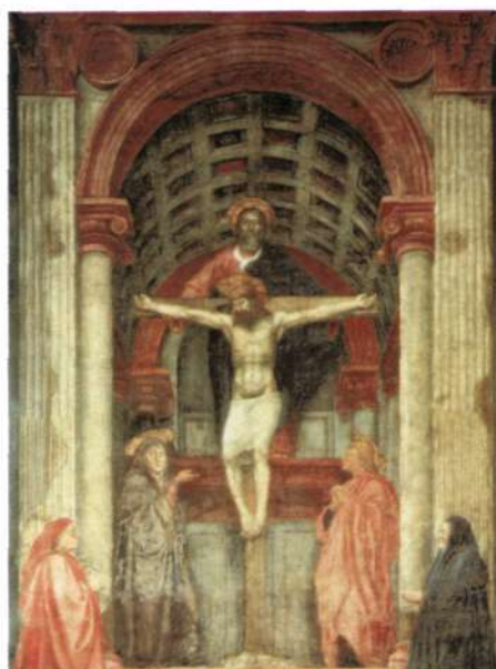
4. Мазаччо. «Троица», 1427 год. Церковь Святой Марии Новелла. Флоренция