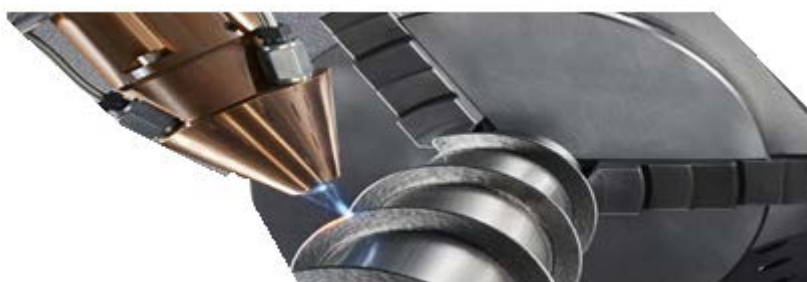
Рисунок 1 – 3D печать

Последние несколько лет 3D-печать (рисунок 1) металлом активно набирала популярность. И это вполне естественно: каждый материал предлагает уникальное сочетание практических и эстетических качеств, может подходить для широкого круга изделий, прототипов, и даже функциональных высокопрочных деталей. Причина, по которой 3D-печать металлом стала столь популярной, заключается в том, что напечатанные объекты можно выпускать серийно.