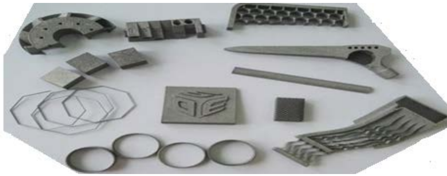
Рисунок 2 – Детали, полученные на 3D принтерах из различных материалов