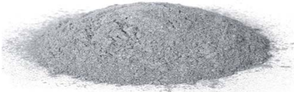
Рисунок 4 – «Атомизированный» порошок для процессов 3D-печати металлом

Детали, выполненные по технологии DMLS, имеют механические свойства, эквивалентные литью.