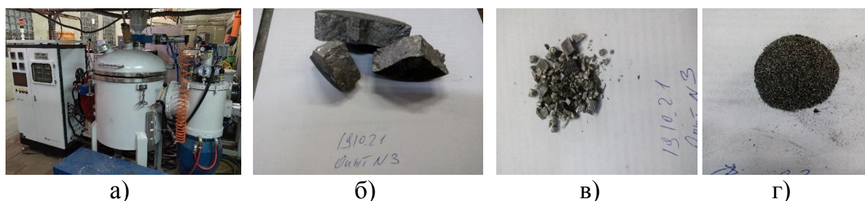
Рисунок 1 – Этапы получения порошка из быстроохлажденных слитков а) вакуумная плавильная печь; б) – полученный слиток; в) после дробления; г) после размола

На рисунке 1 приведены основные этапы процесса изготовления порошка из комплексного силицида.