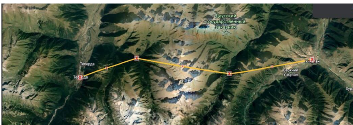
Рисунок 1 – Трассировка и продольный профиль тоннеля

Местоположение автомобильного тоннеля выбрано в России. Тоннель пролегает между городами Теберда и Учкулан (Рис. 1).