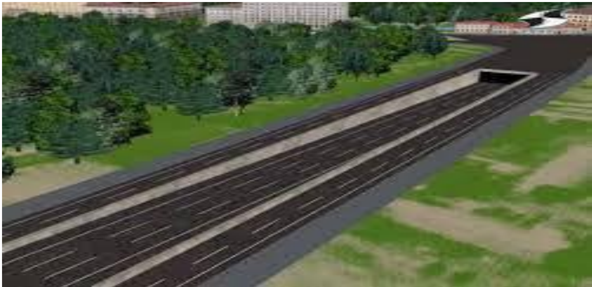
Рисунок 3 – Портал тоннеля

Ряд автомобильных туннелей в России сталкивается с проблемами безопасности. Было установлено, что множество туннелей не отвечают современным требованиям безопасности.