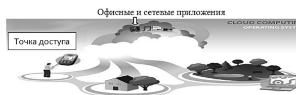
Рис. 1. Доступ в виртуальное пространство с виртуальным компьютером

Облачные вычисления – это процессы распределённой обработки данных, в которых компьютерные ресурсы и сетевые мощности предоставляются пользователю как интернет – сервис. Облачная технология по своей сути является собой процессы создания облачных приложений и работы с ними, без внедрения до-