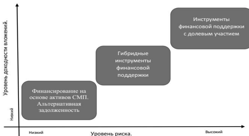
Рисунок 1 – Подход к государственной финансовой поддержке, основанной на риск-менеджменте

Во-вторых, совокупность методов, целью которых служит позволить СМП нарастить альтернативную задолженность, которая позволяет легче управлять имеющимися долгами без потери доходности бизнеса. Такой подход принято называть реструктуризацией долга. Он базируется на принципах, что все стороны сделки с СМП заинтересованы в его успехе, а значит возможно согласовать условия и графики платежей, с тем чтобы СМП имел больше шансов вернуть долг.