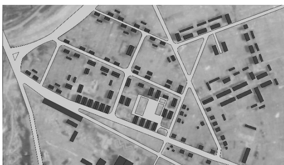
Рис. 1. Планировка жилой зоны рабочего поселка «Коминтерн» в Минске

приемы планировки поселений и всей застройки. Широкое распространение получил регулярно-геометрический (прямоугольный) принцип планировки бесквартального типа (р. п. «Красный Октябрь» в Витебске, р. п. им «Фрунзе» в Речице), квартальный тип использовался редко. Первый, бесквартальный тип, решался полосой застройки линейно вдоль улицы. В одних случаях жилые дома располагались по периметральному типу застройки, в других – строчному или комбинированному. Второй, квартальный тип предполагал расположение застройки в границах уличных магистралей. По такому принципу возводился один из первых поселков в Минске – «Коминтерн». Это градостроительное образование возводило ЖСКТ с одноименным названием, объединяющее рабочих кожевенных, чугунно-литейного, дрожжевинокурного заводов и др. Участок под застройку был отведен вблизи производственного района – «Ляховка» – у железнодорожного полотна недалеко от этих предприятий (рис 1). Жилая зона была представлена одноэтажной деревянной застройкой, выставленной вдоль основных магистралей поселка. Дома были запроектированы двухквартирными с погребами и кладовками, на участках размещали сараи и уборные. Поселок имел невысокий уровень благоустройства, культурно-бытовые объекты и инженерные системы отсутствовали.