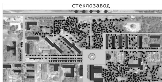
Рис.3 Планировка жилой зоны рабочего поселка стекольного завода в Костюковке

Изменения затронули жилое домостроение поселений: в 1927 г. начинается внедрение каменных двух–трехэтажных домов секционного типа со всеми удобствами, а к середине 1930-х – четырехэтажных. Использовались как индивидуальные, так и типовые проек-