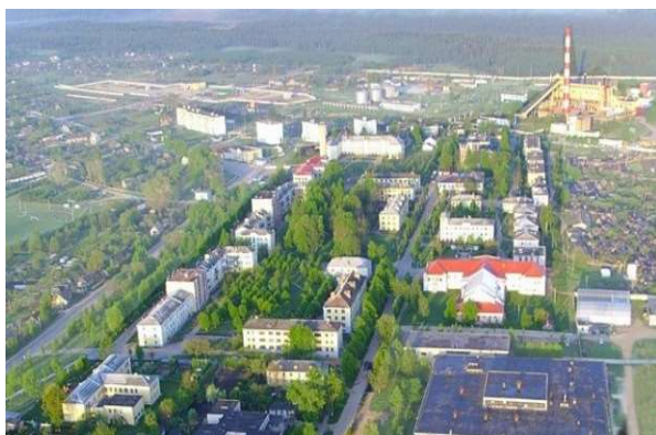
Рис.2. Рабочий поселок Осиновской ГРЭС (городской поселок Ореховск)

который впоследствии получил широкое распространение на территории республики. Квартал превращался в основополагающий планировочный элемент. Внедрение в него социокультурных и бытовых объектов формировало комфортные условия для проживания рабочих и их семей. Подобные поселки на рубеже 1920–30-х гг. появились в Витебске (р. п. фабрики КИМ, диванного комбината и др.), в Могилеве (р. п. завода им. Кирова), Гомеле («Красный Октябрь») и в других городах.