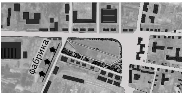
Рис. 5. Планировка жилой зоны рабочего поселка фабрики КИМ г. Витебск

Особенным являлось размещение объекта в структуре поселения – жилой комплекс расположился непосредственно на главной площади поселка, замещая административные и общественные здания (рис. 5).