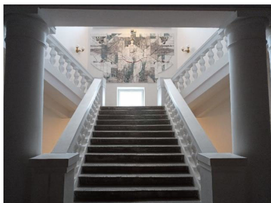
Рис. 2. МДИ в интерьере Белорусской государственной академии искусств

ко поддающихся пластической обработке. При этом скульптурные произведения представлены в интерьере разными видами рельефа, встроенными и независимо стоящими скульптурами. Художникам-монументалистам предлагается использовать как традиционные, так и новые материалы: смальту, стекло, керамику, природный камень, дерево, металл, а также современные синтетические отделочные материалы. Установлено, что при восприятии формы, объема и плоскости наибольшая концентрация внимания должна приходиться на смысловые центры изображения, способствующие быстрейшему раскрытию информации об объекте [5, с. 177–180]. Следует принять во внимание и другие факторы, влияющие на условия видимости произведений искусства в интерьере: назначение интерьера; время, имеющееся в распоряжении наблюдателя; комфортность и атмосферность интерьера (рис. 2).