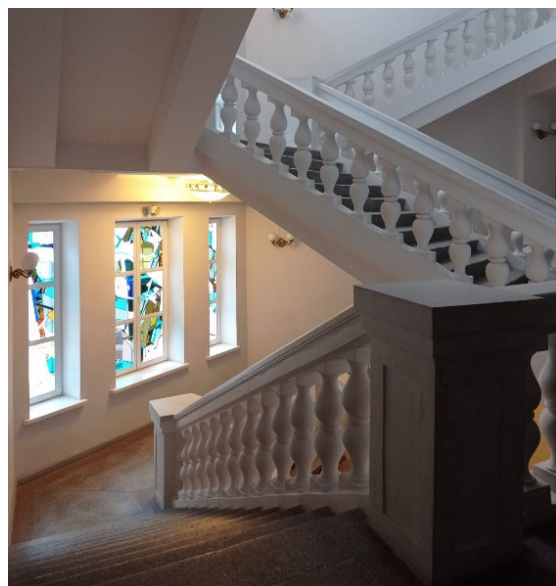
Рис. 3. Витраж в интерьере Белорусской государственной академии искусств

образующих возможностях оптической иллюзии – способности трансформировать стену либо «растворить» ее применением глубокой световоздушной перспективы, стереть границу между реальным и изображенным пространством.