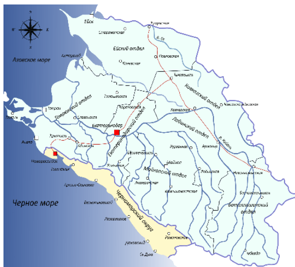
Рис. 3. Административно-территориальное деление Кубанской области, вторая половина 1880-х гг. Рисунок автора

вой и тактической выучки казаков, которые вместе с их общинными хозяйственными качествами, разнообразными жизненными традициями способствовали становлению первоначальных населенных пунктов.