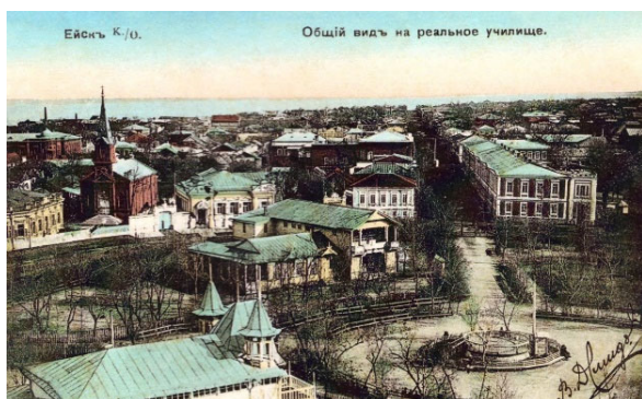
Рис. 5. Ейск. Панорама северо-восточной части города вдоль ул. Керченской 1920-е гг. [8, с. 42]

Вместе с тем, важно подчеркнуть культурный контекст в градостроительном развитии Кубани, который неразрывно связан с архитектурным наследием и народным зодчеством, включающим в себя единство и равенство различных культур, уникальный ресурс исторической среды. В исторических поселениях архитектурное наследие имеет единое территориальное пространство, включающее в себя как градообразующие объекты, являющиеся первоосновой становления населенного пункта, так и отдельные здания, и сооружения,