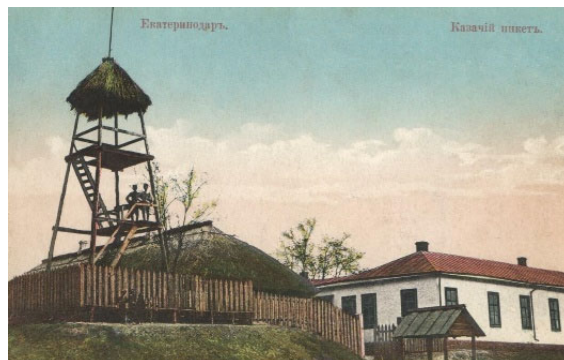
Рис. 2. Екатеринодар. Казачий пост [5]

Для защиты Кубанской кордонной линии, расположенной вдоль труднопроходимой местности, а также охраны отдельных поселений, находящихся в территориальной удаленности друг от друга, была создана цепь фортификационных укреплений, наблюдательных пунктов и постов (рис. 2).