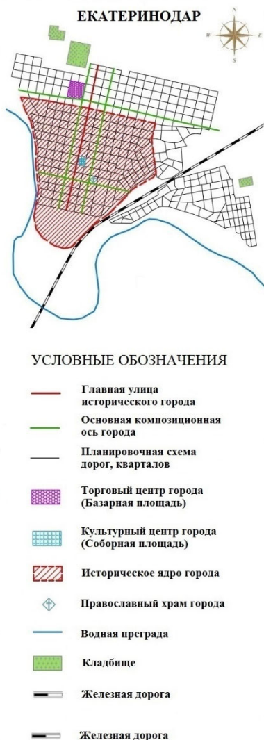
Рис.6. Схема регулярной планировочной структуры г. Екатеринодара (Краснодара), вторая Половина XIX в. Рисунок автора