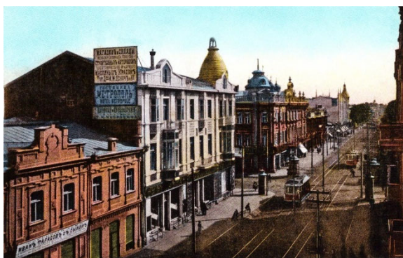
Рис. 7. Исторический центр Екатеринодара (Краснодара). Пересечение четной стороны ул. Красной с ул. Полицейской. Начало XX в. [11]

Заключение. Своеобразие градостроительного развития Кубани заключалось в том, что все поселения непосредственно