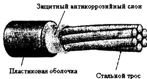
Рисунок 3. Элемент системы армирования типа одного каната

В несвязанной системе постнапряженного армирования канаты с бетоном не находятся в прямой связи. Самые распространенные системы – типа одного каната. Они чаще всего используются для балок, плит перекрытия зданий, фундаментных плит, для многоэтажных автостоянок. Элемент системы армирования типа одного каната состоит из семи проволок, покрытых антикоррозийной смазкой и помещенных в пластиковую оболочку, рисунок 3. За счёт этого напрягаемая арматура имеет возможность свободного перемещения относительно бетона как в процессе натяжения, так и при эксплуатации конструкции.