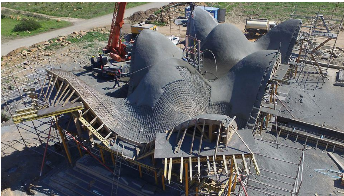
Рисунок 2 – Строительство лесов для опалубки