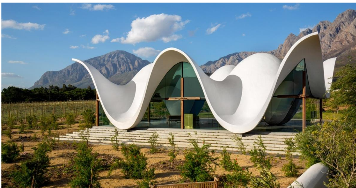
Рисунок 1 – Ландшафт часовни Бошьес

Закончили постройку часовни в Южной Африке на вилле Бошьес. Проект разрабатывали Steyn Studio совместно с TV3 Architects. Сооружение Бошьес расположено вокруг виноградников и большим посаженным садом из гранатов. Сам этот сад расположен вокруг гор.