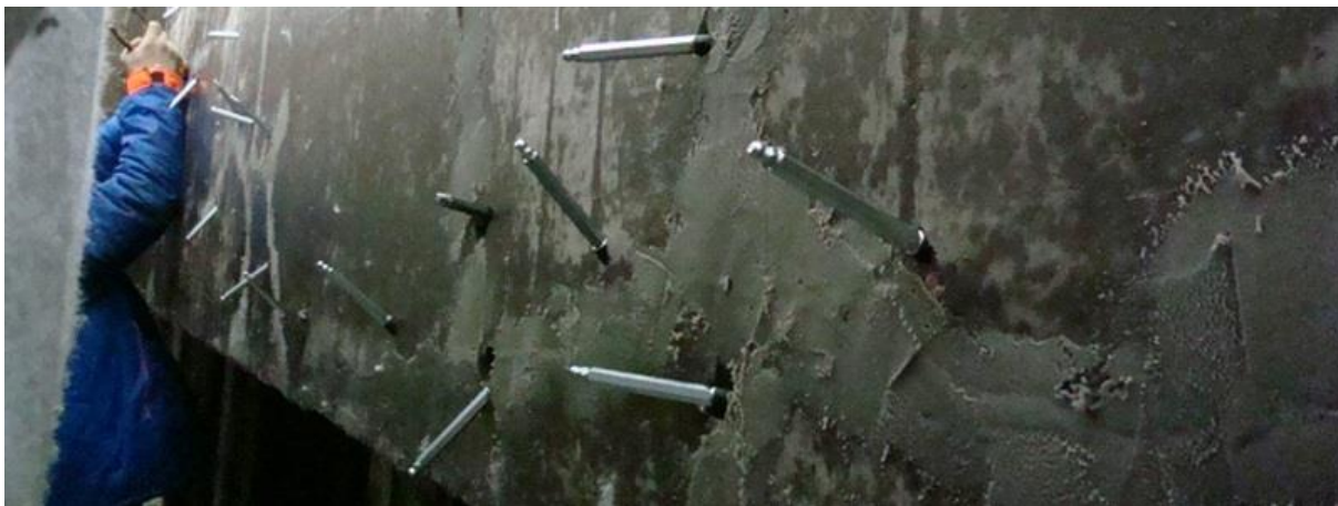
Рисунок 2 – Устройство удлиненных штырей (пакеров) для закачивания инъекционного раствора

Выбор составов, применяемых для этого метода, огромен. Их выбор зависит от технического решения для устранения проникновения воды, свойством и видом грунтов, экономическими показателями. Для заполнения пустот большого объема применяются составы с тонкозернистым компонентом на основе цементных вяжущих компонентов, акрилового геля, низковязких полиуретановых или эпоксидных смол, материалов с гидрофобным цементом.