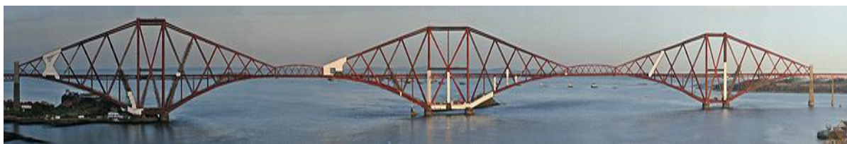
Рисунок 1 – Панорамный вид на мост

Forth Road Bridge (висячий мост); Forth Rail Bridge (консольный мост)