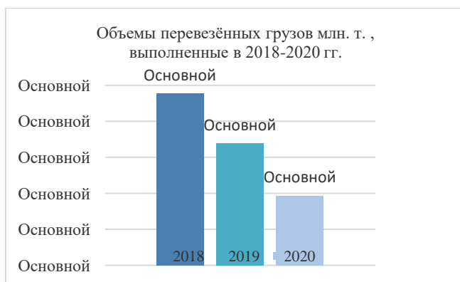
Рисунок 3 – Объемы перевезенных грузов в период с 2018 по 2020 гг.

В 2019 г 41,7% экспорта услуг сформировали транспортно-логистические услуги. При сравнении общих объемов перевезённых грузов за 2018, 2019, 2020 года мы наблюдаем, что наибольший удельный вес за 2020 год пришелся на автомобильный транспорт и составил 159,8 млн. т. (40%), затем железнодорожный 124,9 млн. т. (31,3%) и трубопроводный транспорт 111,2 млн. т. (27,9%), что на