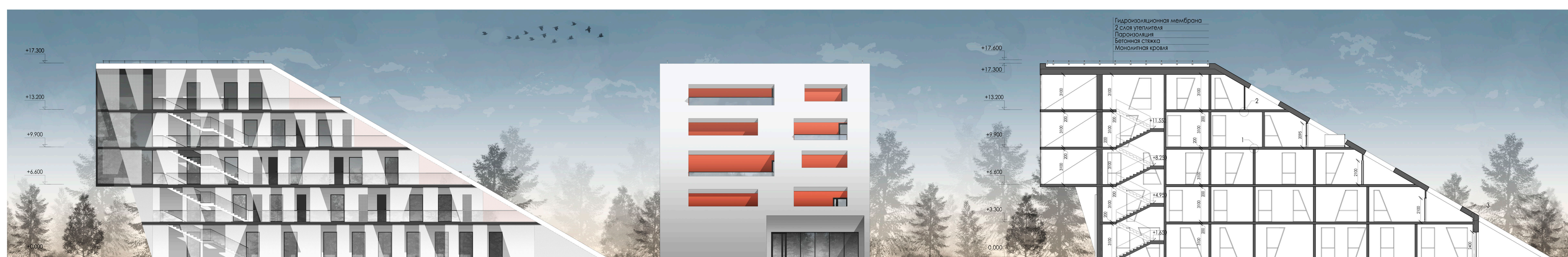
Фасад в осях 1'-9'