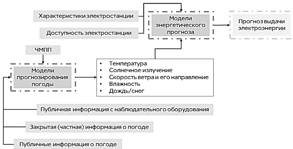
Рисунок 2 – Схематичная структура взаимодействия элементов цепочки прогнозирования производительности блок-станции на основе ВИЭ

скоординированного взаимодействия между производителем возобновляемой энергии и системным оператором. На рисунке 2 представлена типовая схема взаимодействия элементов прогнозирования в процессе получения итогового прогноза выдачи электроэнергии в сеть (производства электроэнергии).