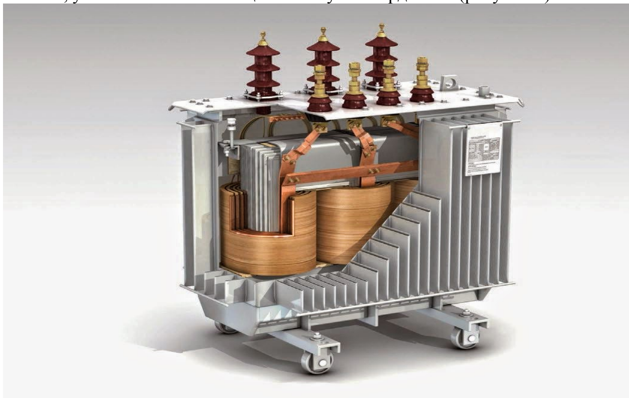
Рисунок 1 – Простейший трансформатор

Трансформатор – это устройство, которое предназначено для понижения или повышения переменного напряжения. Трансформатор состоит из двух обмоток, установленных на общий замкнутый сердечник (рисунок 1).