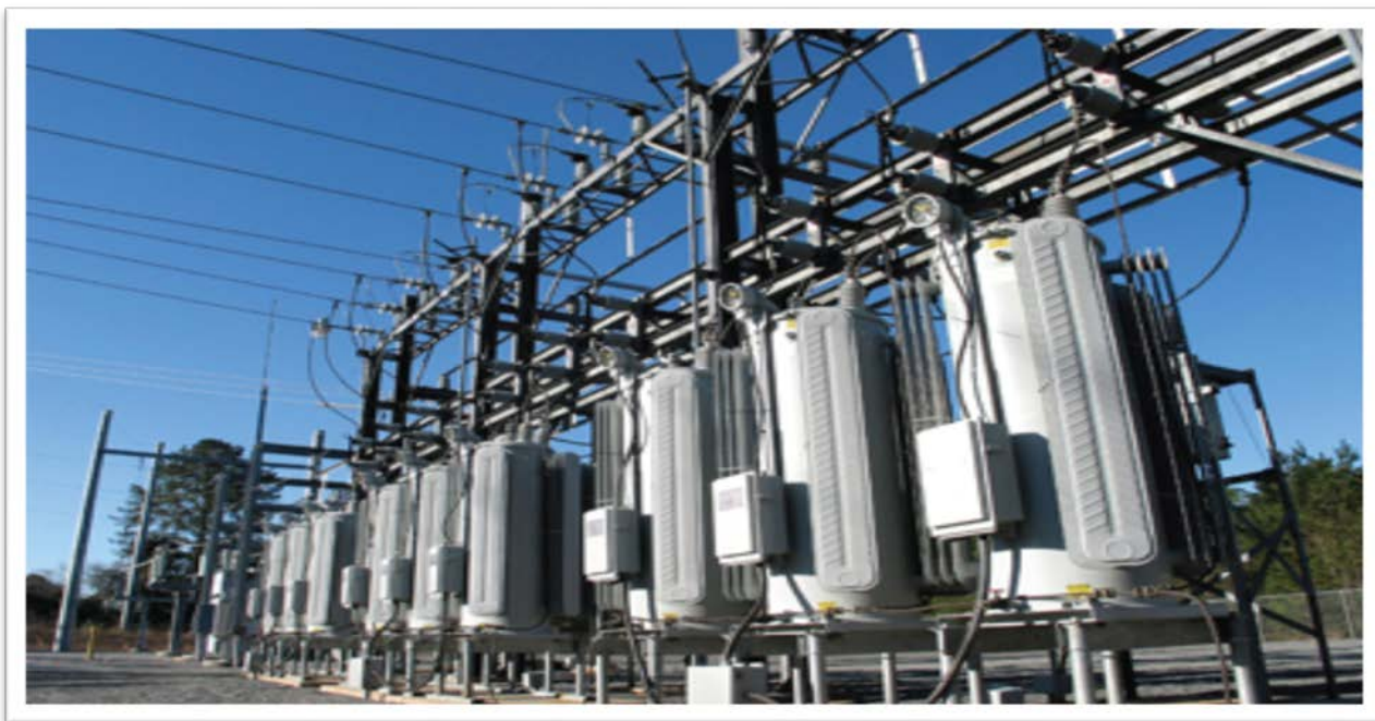
Рисунок 4 – Электроустановка

накопления, передачи, преобразования, распределения электрической энергии или преобразования ее в другой вид энергии (рисунок 4).