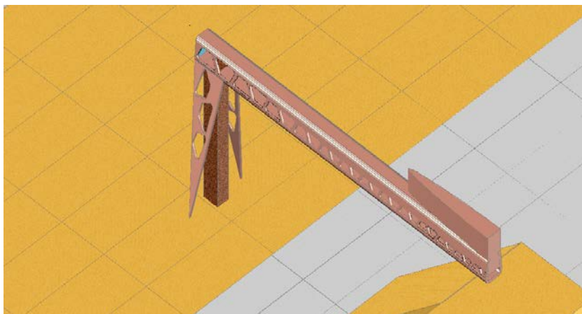
Рисунок 1 – Общий вид моста.

Для этого инженерам пришлось решить множество проблем. Главной из них явилось то, как преодолеть железнодорожный путь, при этом подняться на высоту более чем 20 метров? Для этого в одной опоре моста были сконструированы лифты и лестницы внутри для поднятия на высоту 23 метров. Потому что именно столько составляет высота моста. Поэтому, глядя со стороны, кажется, что мост стоит на одной опоре, так как вторая опора намного короче и скрывается среди зелени парка. Также стояла проблема обхода всех линий электропередач, проводов, проходящих по воздуху, автобусных платформ и поездов. Все эти трудности были успешно решены, и на свет появилось это чудесное произведение искусства.