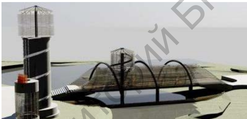
Рисунок 2 – Общий вид моста.

4. Указанная выше концепция не является единственным правилом в архитектурном проектировании. Существует и противоположная позиция, которая не предполагает отражения в облике моста его конструктивного решения. При таком подходе фасадная композиция строится на основе закономерностей художественной гармонии, без связи с внутренней структурой сооружения. В этом случае конструкция и форма существуют отдельно друг от друга и проектируются независимо. Также не стоит забывать о том, что архитектору необходимо решить задачу соотношения моста и окружающей среды. Под окружающей средой понимается как естественная природа, так и самая разнообразная городская застройка.