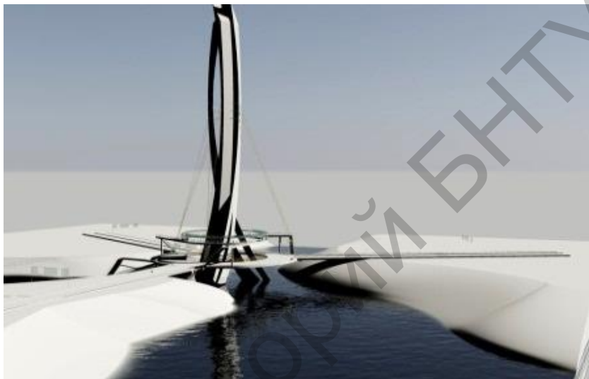
Рисунок 1 – Общий вид моста.

2. Задача создания художественно полноценных мостов не ограничивается включением в их композицию отдельных архитектурных деталей, пусть даже совершенных с эстетических позиций. Невозможно создать архитектуру моста только установкой перил или фонарей, какими бы достоинствами они не обладали.