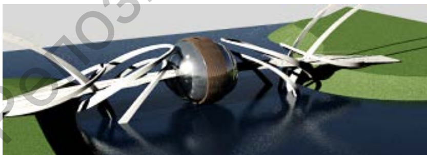
Рисунок 3 – Общий вид моста.