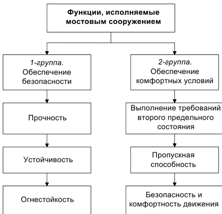
Рисунок 1–Функции, исполняемые мостовым сооружением

– каждая система второго уровня содержит системы третьего уровня, состоящих из последовательно и параллельно (комбинировано) соединенных элементов, которые, в свою очередь, являются системами четвертого уровня. Это иерархическое членение продолжается до нужной степени подробности (Рис. 2).