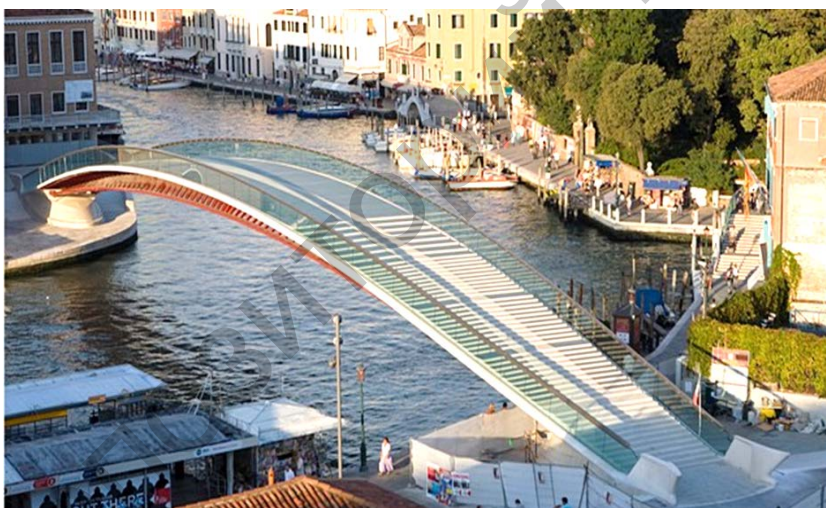
Рисунок 3 – Общий вид сооружения

Мост Конституции подвергался серьезной критике в процессе строительства. Основной критике подвержены высокая стоимость строительства: первоначальный бюджет, который вырос с 7,2 млн. до 11,2 млн. Когда горожане увидели построенный и отделанный мост, начались возмущения, что современная архитектура моста, не вписывается в венецианский архитектурный стиль. Неудачный вы-