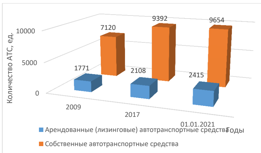
Рисунок 2 – Количество собственных и лизинговых автотранспортных средств

Данные рис. 2 показывают, что количество лизинговых транспортных средств увеличилось в течение 2009–2020 гг. на 644, а находящихся в собственности на 2534 автомобиля.