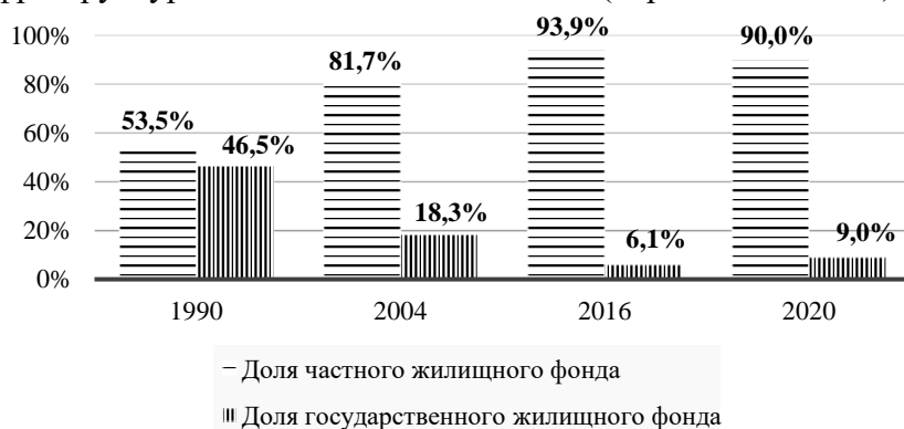
Рисунок 1 – Структура жилищного фонда Республики Беларусь за 1990, 2004, 2016, 2020 годы

В работе оценена динамика мер по строительству жилых домов и объектов инженерной и транспортной инфраструктуры к ним за последние 5 лет (период 2016-2020).