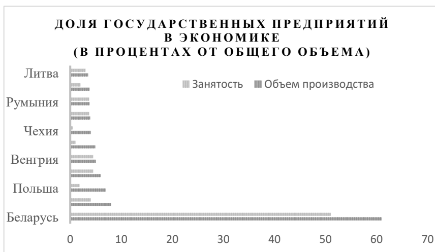
Рисунок 3 – Доля государственных предприятий в экономике РБ по сравнению с другими странами.

На государственных предприятиях Республики Беларусь работает около 50 процентов наемных работников. Госпредприятия производят более 60 процентов продукции, на них приходится более 77 процентов объема промышленного производства. Сравнение Беларуси со странами, ориентированными в большей степени на рыночную экономику, свидетельствует о значимости сектора госпредприятий для экономики нашей страны (рисунок 3).