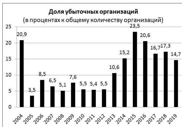
Рисунок 1 – Доля убыточных организаций

Доля убыточных организаций в Республике Беларусь представлена на рисунке 1.