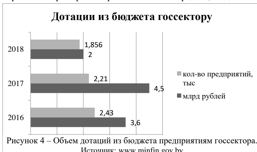
Рисунок 4 – Объем дотаций из бюджета предприятиям госсектора.

Объемы господдержки в последние пять лет сокращаются. А директивное кредитование за последние 8 лет сократилось примерно в 3 раза. Но объемы средств, выделяемые из бюджета на