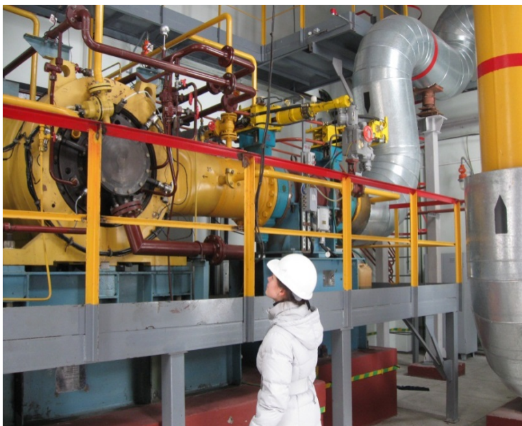
Рис. 2. Помещение детандерного отделения на Гомельской ТЭЦ

Стабильную работу ДГУ в составе Гомельской ТЭЦ-2 обуславливает несколько первоочередных факторов, которые были учтены еще на этапе ее разработки: - значительные сезонные и суточные колебания расхода газа через ГРП ТЭЦ (от 30000 до 150000 \text{м}^3/\text{ч} ); - повышенные требования к надежности работы детандер-генераторной установки, через которую должно проходить 80 % от всего расхода газа, поступающего на ТЭЦ.