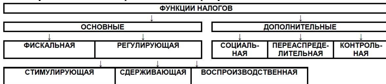
Рисунок 1 – Функции налогов

Функции налогов представлена на рисунке 1.