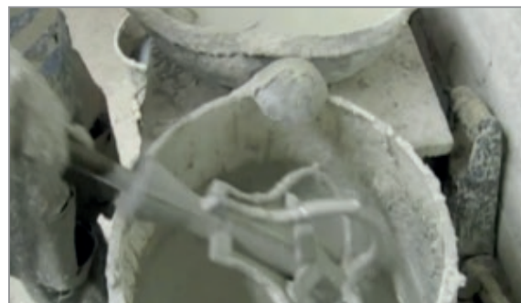
Рис. 2. Нанесение огнеупорного покрытия методом окунания