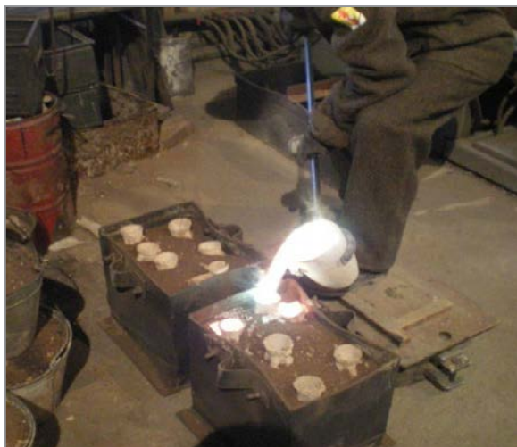
Рис. 8. Заливка форм