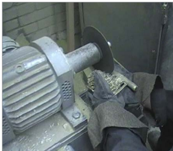
Рис. 9. Отделение литниково-питающей системы абразивным диском