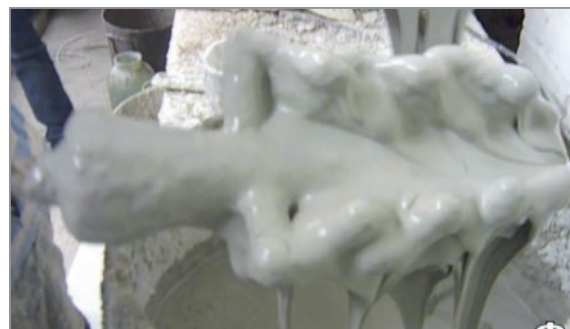
Рис. 4. Последний «закупорочный» слой керамической формы

Если форма содержит мелкие отливки, смонтированные в виде пакета, желательно обеспечивать сращивание отдельных элементов в единый блок методом направленного нанесения суспензии и обсыпки.