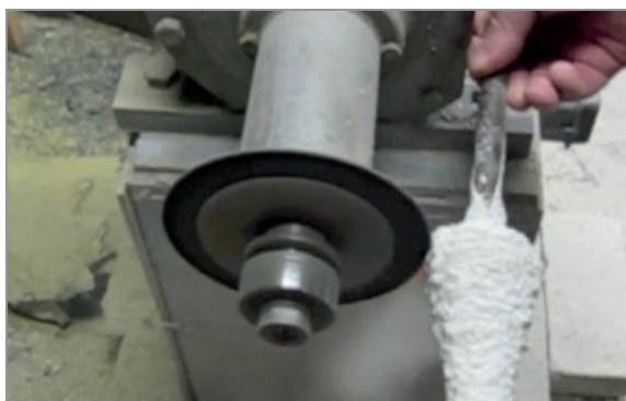
Рис. 5. Прорезка формы перед удалением модельного состава

Подготовленные формы устанавливают в корзину (рис. 6) в количестве 6–8 штук. Для обеспечения плавного перемещения силами одного оператора масса корзины не должна превышать 15 кг. Дно корзины выполнено из перфорированного стального листа. Диаметр отверстий 4–8 мм.