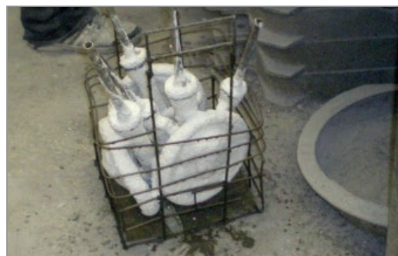
Рис. 6. Формы, помещенные в корзину для вытопки модельного состава