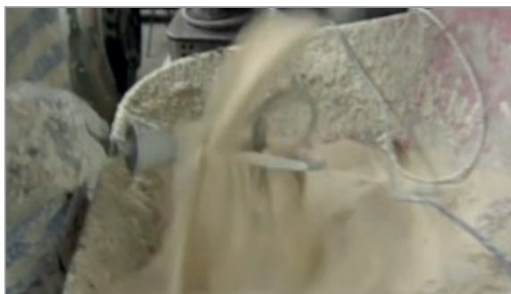
Рис. 3. Нанесение зернистого материала формы методом ручной обсыпки