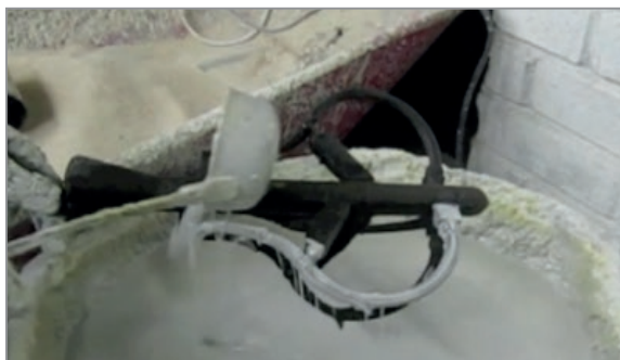
Рис. 1. Нанесение огнеупорного покрытия на основе ЭТС

Обсыпают формовочным песком с зернистостью 0,2–0,3 мм. Сушку ведут интенсивно турбулентным потоком воздуха. Важно организовать потоки в трех плоскостях. Температура сушильного агента 25–28 °С. Время сушки 2–6 ч в зависимости от влажности воздуха и сложности форм. Начиная с 3–4-го слоя зернистость обсыпки увеличивают до 0,63–1,5 мм. Для художественного литья предпочтительно формировать 4–5 слоев. Последний слой закупорочный, без обсыпки зернистым материалом (рис. 4).