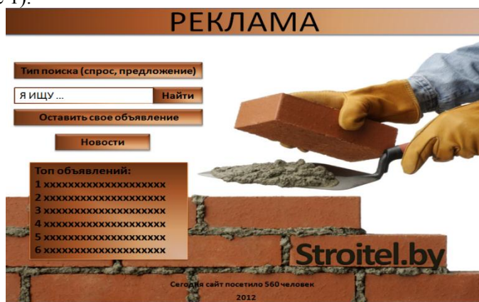
Рисунок 1 Макет приветственной страницы

Наш проект не подразумевает нововведений в этом деле. Получать доход планируется при помощи своего сайта "Stroitel.by", путем размещения рекламы и платного сервиса. Данный сервис предназначен для пользователей, которым нужна помощь в оказании строительных услуг, а также пользователей, которые могут предложить эти услуги. Сайт ориентирован на Республику Беларусь, т.е. работать он будет на все областные центры, а также крупные города. Рассмотрим макет приветственной страницы (рисунке 1).