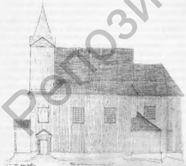
Рис. 3. Боковой фасад деревянной униатской церкви в д. Леонполь Витебской области. 1929 г. Арх. Б. Левко

формы, расположенное в притворе под башней зашито. На чертеже бокового фасада в притворе кроме главного входа для особых церковных торжеств расположен боковой вход, выходящий в сторону