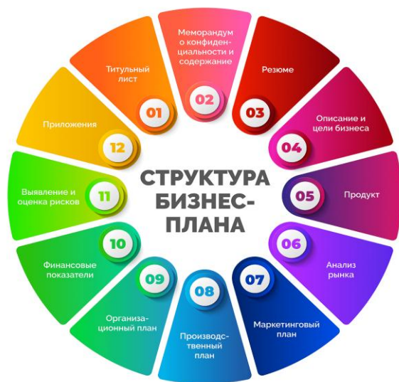
Рисунок 2 – Структура бизнес-плана

Бизнес-план инвестиционного проекта может включать разделы, представленные на рисунке 2.