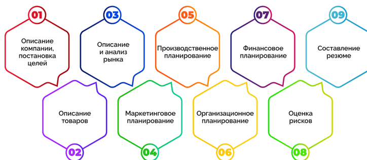
Рисунок 4 – Этапы составления бизнес-плана

Пошаговый пример составления бизнес-плана представлен на рисунке 4.