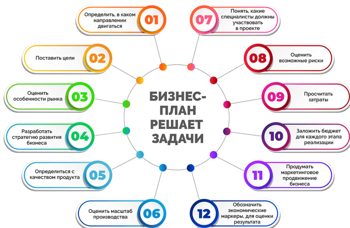
Рисунок 1 – Задачи, которые решает бизнес-планирование

Задачи, которые решает бизнес-план представлены на рисунке 1.