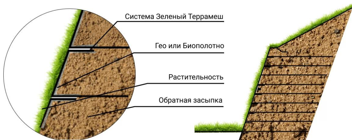
Рисунок 1 – Пример работы системы Terrameah Green

Принципиальная разница такой армогрунтовой конструкции по отношению к гравитационным подпорным стенам, заключается в дополнительной устойчивости за счёт давления обратной грунтовой засыпки на габионные «хвосты»