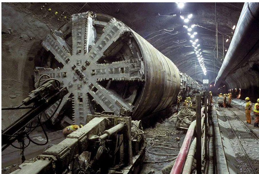
Рисунок 1 – Строительство тоннеля под Ла-Маншем