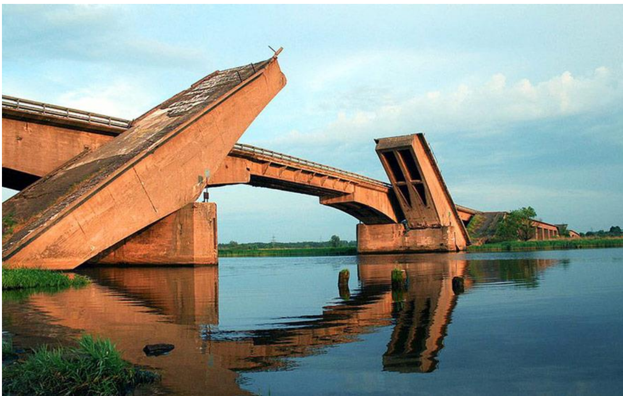
Рисунок 2 – Берлинский мост

К сожалению, после всех реконструкций первоначальный облик моста не сохранился.