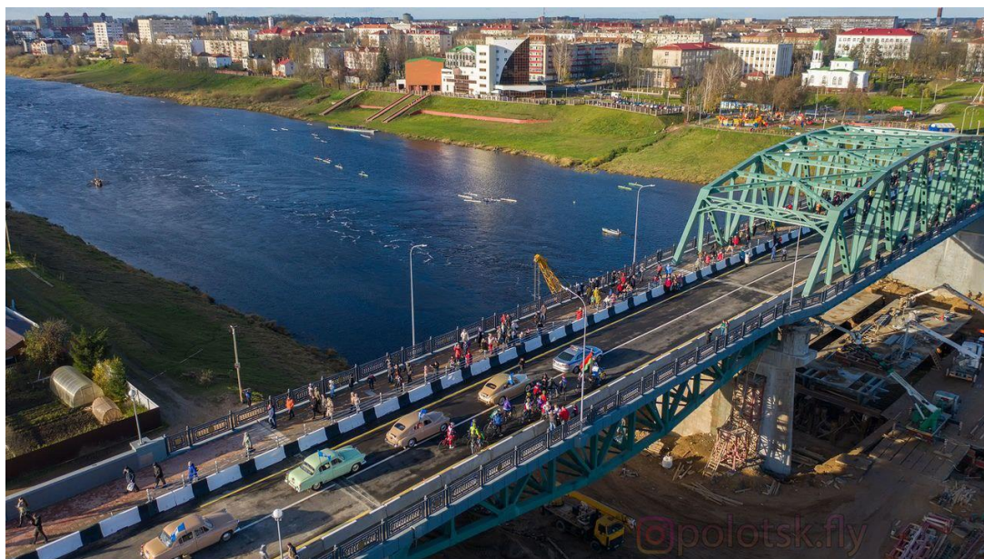
Рисунок 2 – Покровский мост в Полоцке после реконструкции

– 4,5 м. На одном из выездов с моста организовано кольцевое движение. На подходах к мосту установлены ограждения, новое освещение и декоративная подсветка (Рис. 2).