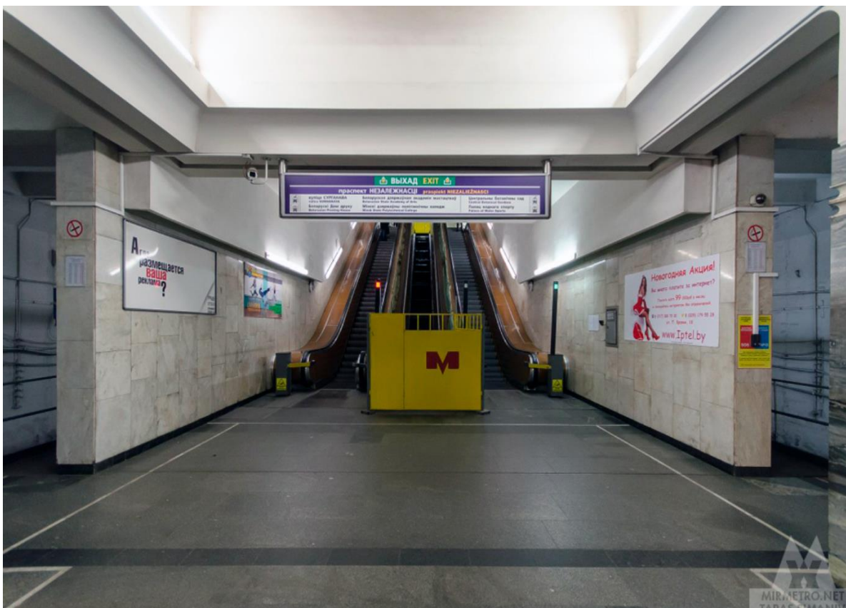
Рисунок 2 – Станция метро Академия наук (сегодня)

Станцию метро Академия наук была сдана в эксплуатацию 29 июня в 1984 году (Рис. 2).