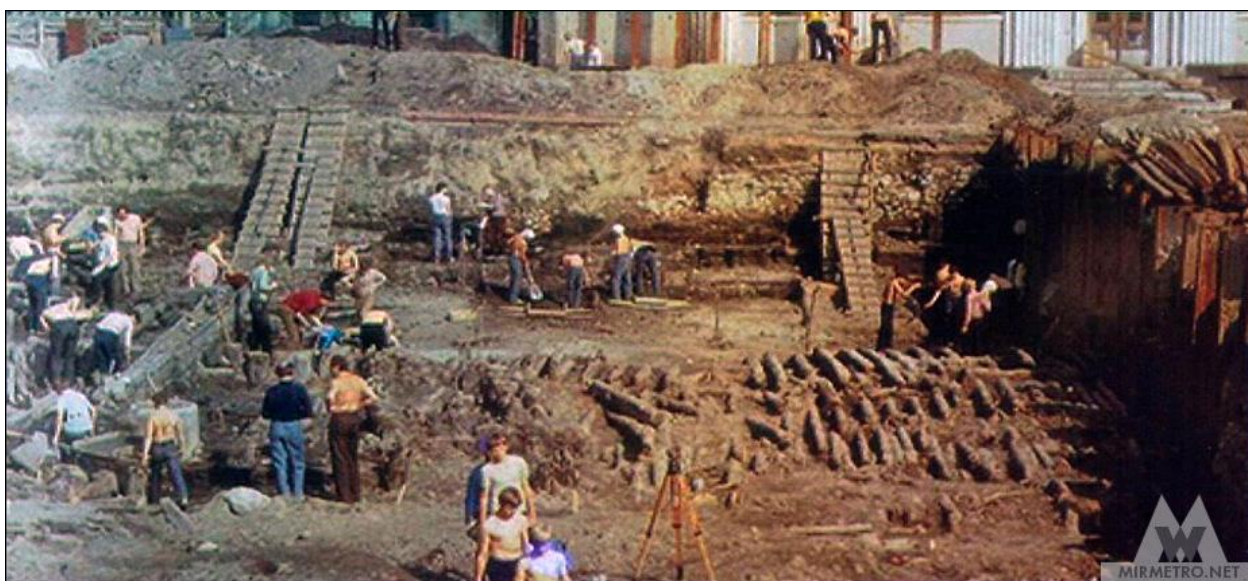
Рисунок 2 – Первые этапы строительства станции «Немига»

Прокладка тоннелей метро вблизи Кафедрального Собора столкнулась с проблемой: в фундаменте здания обнаружился трещины. Чтобы укрепить грунт и защитить собор от вибраций, в итоге применили химическое закрепление и резиновые амортизаторы под рельсы (Рис. 1).