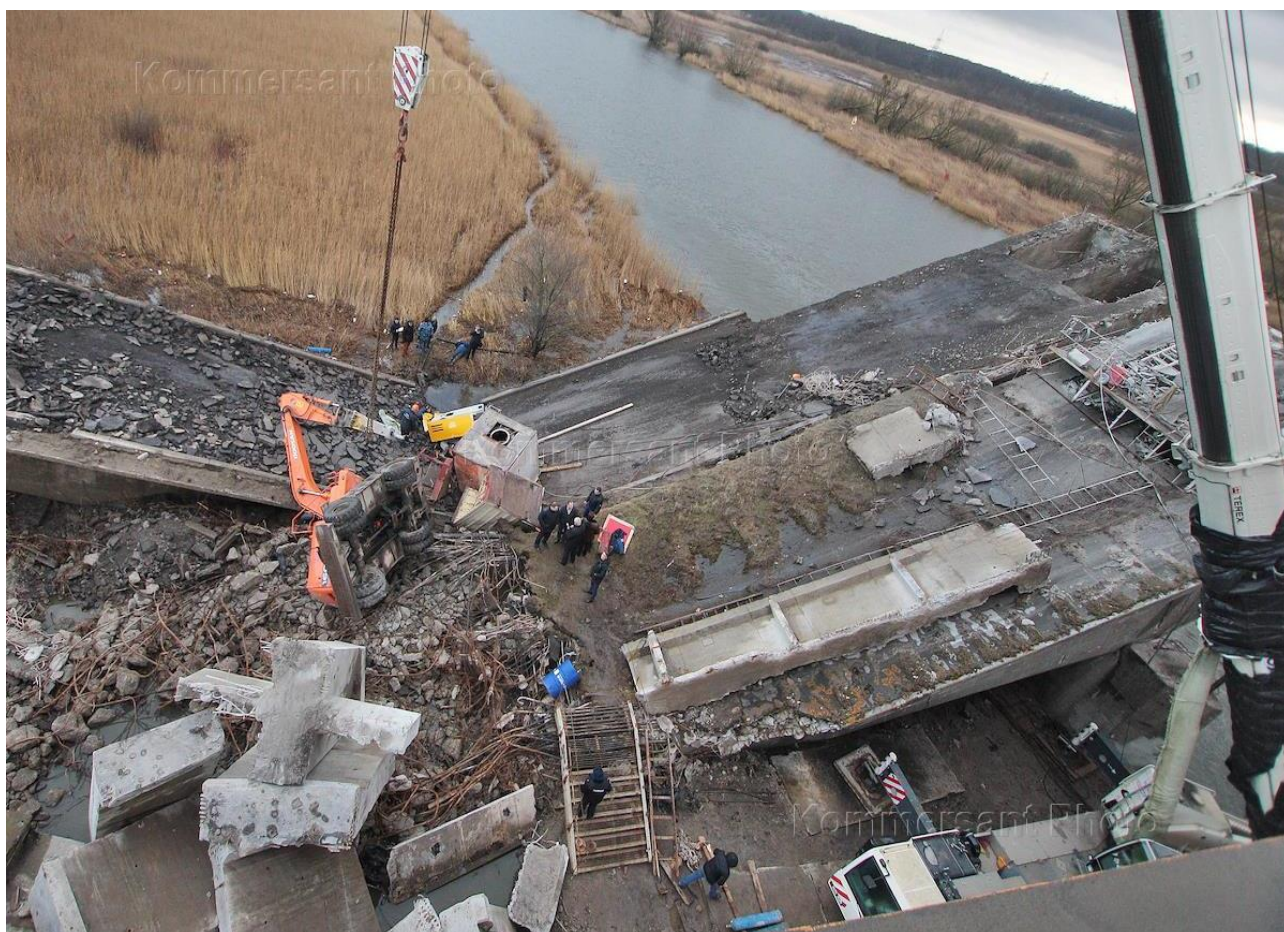
Рисунок 1 – Вид Берлинского моста после обрушения

Берлинский (ранее — Пальмбургский) мост был построен в 1938 году, по программе дорожного строительства, принятой в Германии в 1928 году. Мост находился на направлении Кёнигсберг-Берлин и был построен для перемещения моторизованных частей вермахта за весьма короткие промежутки времени. Немного позднее, в 1945 году, немецкие войска подорвали Пальмбургский мост, чтобы сдержать наступление советский войск. А в 2013 году, во время реставрации обрушилась одна секция моста, в результате чего погибли 4 строителя и ещё 2 получили травмы (Рис. 1).