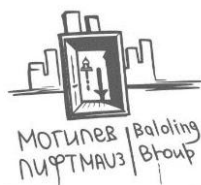
Рисунок 4 – Графический анализ знаково-символических элементов по теме задания «Лифт»

Для усиления ассоциативной связи с брендом название компании было интегрировано в окружающее пространство логотипа, что способствует мгновенному визуальному восприятию и упрощает идентификацию предприятия.