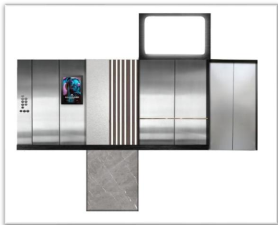
Рисунок 3 – Развёртка лифта (без детализации)

Основным композиционным элементом логотипа выступает изображение лифта, символизирующее основное направление деятельности компании. Дополнительно в структуру включён ромб, который выполняет декоративную функцию, дополняя основную графическую конструкцию без привнесения прямого смыслового значения.