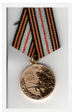
Рисунок 7 - Памятные знаки

Таким образом, память должна жить в наших сердцах. И мы, молодое поколение, должны с уважением относиться к людям, которые защищали нашу Родину, были ей преданы до последнего.