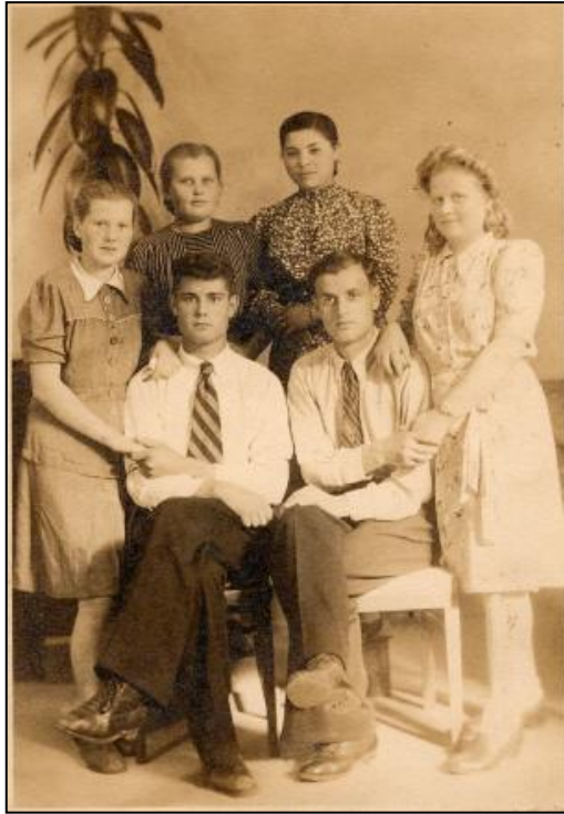
Рисунок 4 - Хозяин ресторана с женой и военнопленные

В 1945 году прабабушку и других узников освободили американцы. Они очень хорошо относились к пленным. Всем раздавали шоколад. И вскоре начали отправлять на Родину.