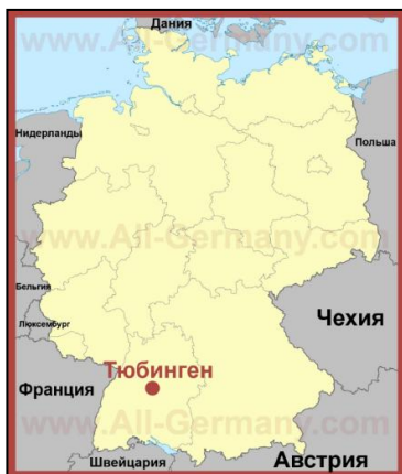
Рисунок 3 - Местоположение города Тюбинген

Через некоторое время их привезли в Германию, город Тюбинген. В этом городе моя прабабушка пробыла до самого конца войны.