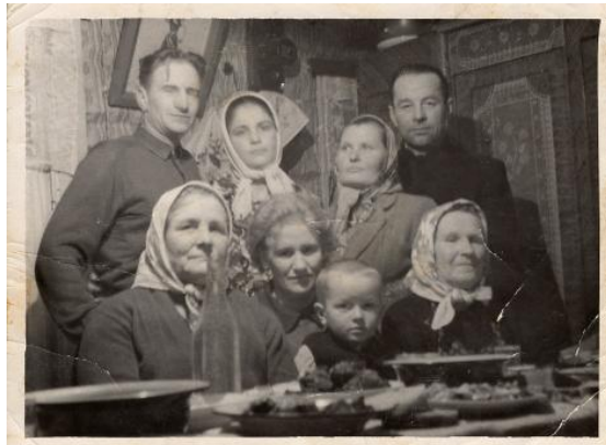
Рисунок 6 - Агрипина в кругу друзей

У прабабушки была возможность остаться в Германии или поехать к родному брату во Францию. К сожалению, из-за недостающих документов она не смогла встретиться с братом. Хозяевам ресторана она ответила, что хочет вернуться на Родину, к родным.