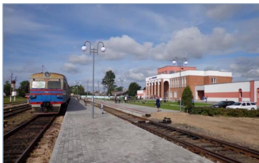
Рисунок 2 - Станция города Глубокое (современный вид)

В один из осенних дней 1943 года в деревню пришли немцы. Они стали собирать молодых девчат и юношей. Сначала согнали всех в сарай, а потом посадили в грузовую машину и повезли на станцию города Глубокое (рисунок 2).