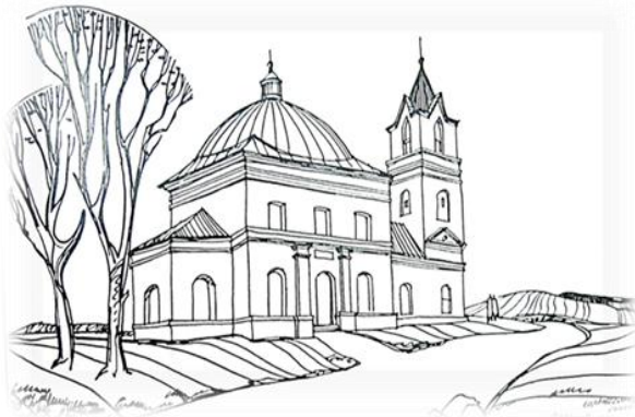
Рисунок 3 – Церковь св. Николая Чудотворца в Волотове. 1801 – 1805 гг. Арх. Дж. Кларк. Общий вид (реконструкция Морозов В. Ф.)

Петропавловский собор является выдающимся памятником архитектуры позднего классицизма. Здание имеет центрическую композицию. При конструировании сооружения за основание был взят четырехконечный крест с развитым трансептом, снаружи размещены четыре портика с колоннами дорического ордера. Ствол колонны завершала круглая криволинейная подушка (эхин) и квадратная плита (абак). Вверху расположен ребристый купол на прорезанном окнами барабане, который стал центральным элементом архитектуры собора [3].