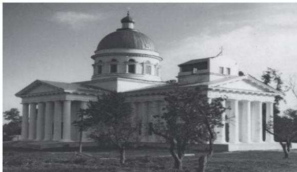
Рисунок 4 – Петропавловский собор в г. Гомеле

Петропавловский собор является выдающимся памятником архитектуры позднего классицизма. Здание имеет центрическую композицию. При конструировании сооружения за основание был взят четырехконечный крест с развитым трансептом, снаружи размещены четыре портика с колоннами дорического ордера. Ствол колонны завершала круглая криволинейная подушка (эхин) и квадратная плита (абак). Вверху расположен ребристый купол на прорезанном окнами барабане, который стал центральным элементом архитектуры собора [3].