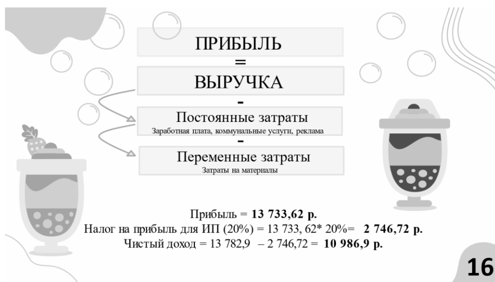
Рисунок 2 – Расчет чистого дохода Источник: собственная разработка авторов.

Точка безубыточности, как один из основных показателей, с помощью которых управляют финансовым состоянием бизнеса, определяет минимальную выручку, при которой бизнес полностью покрывает свои расходы. Исходя из нашего анализа, для достижения этого уровня необходимо продавать 29 стаканов в сутки (888 стаканов в месяц) или получать выручку в размере 7101,34 руб. в месяц. При таком доходе наше кафе покроет свои затраты.