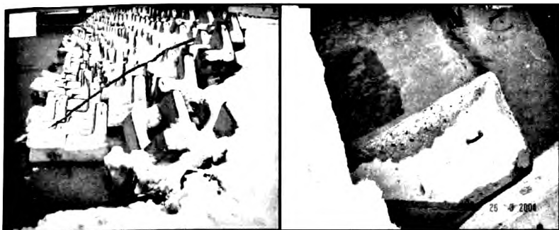
Рисунок 1 – А - общий вид берегозащитного сооружения корневой части причала МОФ (п. Пригородное, завод СПГ, о. Сахалин) в зимний период; Б - характер разрушения бетонных блоков (гексабитов) после первого зимнего сезона