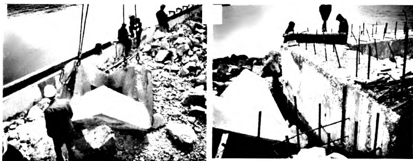
Рисунок 2 – Характерный вид разрушения бетона в зоне переменного уровня после первого зимнего сезона: А- берегоукрепление из гексабитов в порту Козьмино (г.Находка, Приморский край, 2008 г); Б- причальная стенка в порту Углегорск (о. Сахалин, 2010 г).

деградации бетона в поврежденных блоках прекратились, они сохраняют свои эксплуатационные показатели в течение 15 лет. Блоки, которые устанавливались в зону переменного уровня с предварительной выдержкой, сохраняют первоначальный внешний вид в течение всего периода эксплуатации- 15 лет.