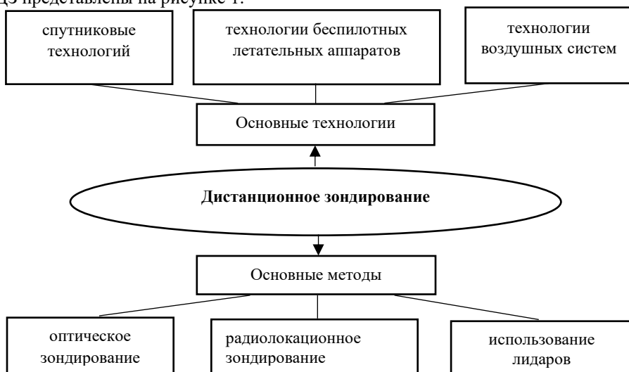
Рисунок 1-Основные технологии и методы ДЗ

Важным инструментом для мониторинга состояния лесов являются технологии дистанционного зондирования, которые позволяют получать информацию о состоянии лесов на больших территориях с высокой точностью и оперативностью. Дистанционное зондирование (ДЗ) относится к основному методу сбора информации о состоянии земной поверхности и атмосферы с использованием различных технологий. Данный метод обращения с информацией базируется на применении спутниковых технологий, технологий беспилотных летательных аппаратов и технологий воздушных систем [1]. Основным механизмом процесса ДЗ заключается в регистрации электромагнитного излучения, отраженного от объектов, без необходимости непосредственного контакта с ними. ДЗ широко применяется в различных областях, включая экологию, сельское хозяйство, градостроительство, мониторинг природных ресурсов и другие [1]. Основные технологии и методы ДЗ представлены на рисунке 1.