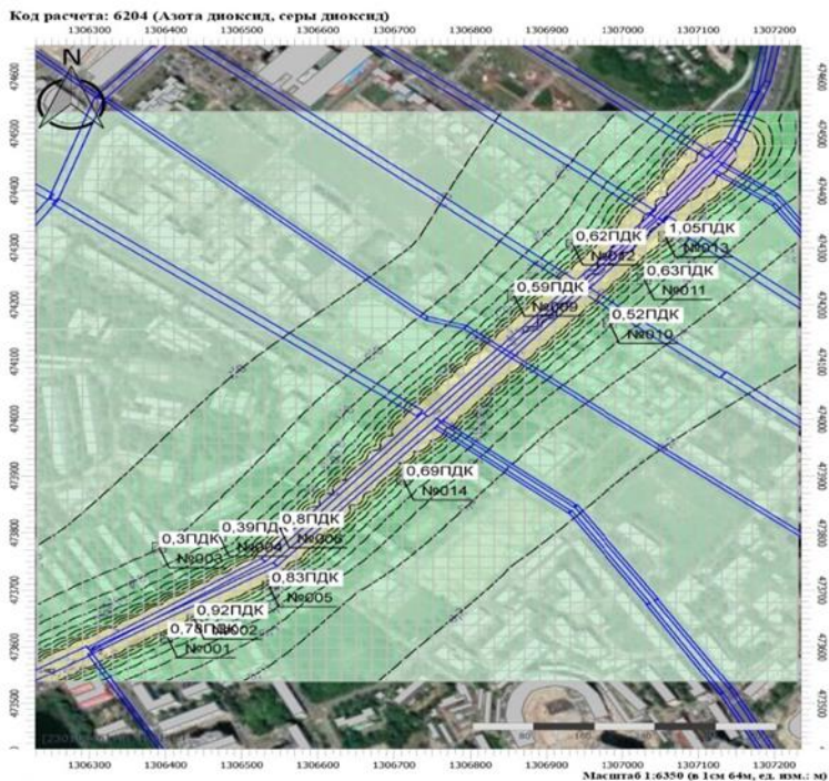
Рис.2. Поля максимальных концентраций суммы 6204

Выводы. Таким образом, в зависимости от интенсивности движения транспорта на участках улично-дорожной сети и сложившейся застройки на прилегающих к автодорогам территориях, при неблагоприятных условиях автотранспорт может формировать высокие концентрации вредных веществ [4]. Следовательно, загрязнение городского воздуха выбросами автотранспорта на наиболее напряженных участках должно подлежать систематическому контролю.