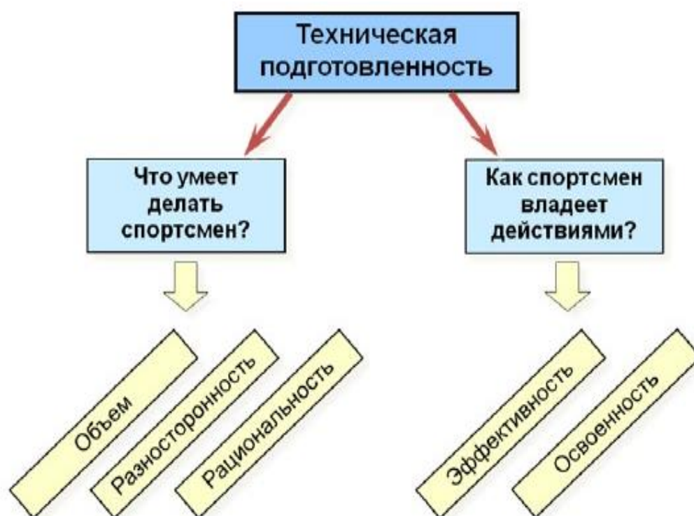
Рисунок 4 – Оценка технической подготовленности

Оценка технической подготовленности (рисунок 4). Контроль за технической подготовленностью заключается в оценке количественной и качественной сторон техники действий спортсмена при выполнении соревновательных и тренировочных упражнений.