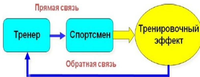
Рисунок 3 – Обратная связь в системе управления состоянием спортсмена

Наиболее информативным и полным является комплексный контроль . На основе комплексного контроля можно правильно оценить эффективность спортивной тренировки, выявить сильные и слабые стороны подготовленности спортсменов, внести соответствующие коррективы в программу их тренировки, оценить эффективность избранной направленности тренировочного процесса, того или иного принятого решения тренера.