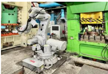
Рисунок 2 – Роботизированный манипулятор

Применение автоматизированных систем позволяет сократить время выполнения операций, увеличить объем произведенной продукции, а также обеспечивает бесперебойную работу оборудования. Высокая точность и стабильность отлаженных действий позволяет увеличить объем произведенной продукции. Снижаются риски для работников, так как рабочие только контролируют и регулируют производственную линию с помощью электрического управляющего оборудования.