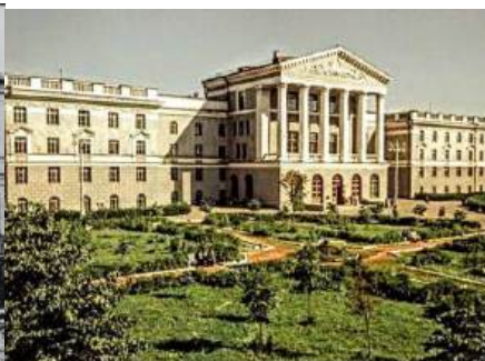
Рисунок 5 – Отстроенный главный корпус БПИ 1960 года

Вторым этапом, важным в развитии инженерно-экономического образования на территории СССР, стала Косыгинская реформа (так