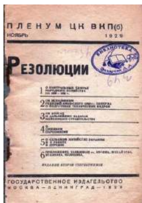
Рисунок 1 – Проект резолюции по реформе высшего образования

3. 01 октября 1930 года на базе Харьковского коммерческого училища Императора Александра III – Харьковский инженерно-экономический институт (ХИЭИ).