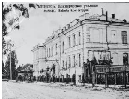
Рисунок 4 – Коммерческое Минское училище

Годы Великой отечественной войны – большая трагедия белорусского народа. С началом войны БПИ временно приостановил свою деятельность. Преподаватели и студенты были мобилизованы на фронт или отправлены на работу в тыл. Однако буквально в год окончания войны институт вновь открыл свои двери для студентов. На фотографии (рисунок 5) уже отстроенный главный корпус БПИ 1960 года.