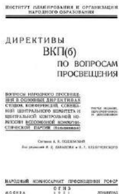
Рисунок 2 – Директивы ВКП(б) по вопросам просвещения